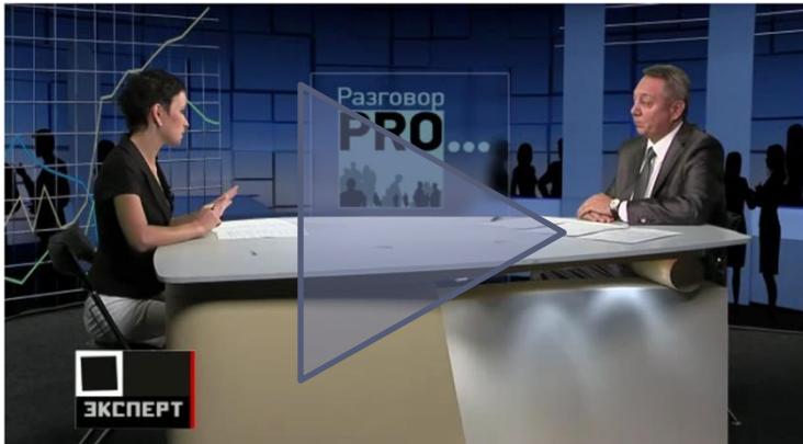
Телеинтервью в рамках программы «Разговор PRO» на канале Эксперт ТВ